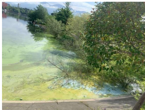
Burimi: Burime të hapura (media) 2