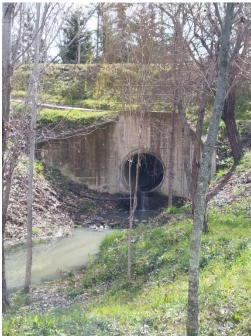
Foto 5-9: Foto nga verifikimi në terren i grupit të auditimit në datën 06.03.2025: Gjendja e tombinave të kanaleve të ujërave të shiut që derdhen në PMLAT

Nga verifikimi në terren, i kryer nga grupi i auditimit, u konstatuan raste ku tombinat e kanaleve të ujërave të shiut ishin plotësisht të bllokuar, ose kishte rrjedhje potencialisht të ujërave të ndotura, si dhe aromë të pakëndshme (disa nga rastet paraqitura në fotot më poshtë).