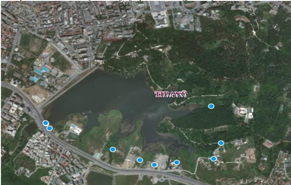
Burimi: Grupi i auditimit