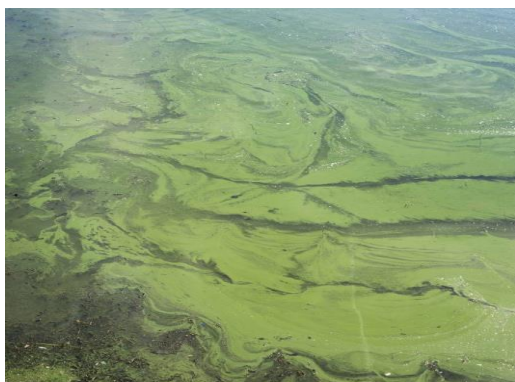
Burimi: Burime të hapura (media) 3