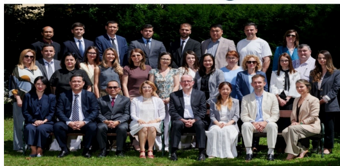
Debt Management Performance Assessment (DeMPA) Workshop Vienna, Austria from July 14-18, 2025

THE WORLD BANK IBRD • IDA | WORLD BANK GROUP